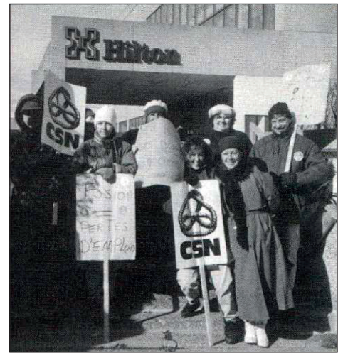
Le Hilton a été la scène d'un lock-out de 9 mois en 1992.

Les années 1990 furent une période difficile pour les travailleuses et les travailleurs de l'hôtellerie. Face à une conjoncture morose, les employeurs partent à l'offensive pour reprendre ce que les syndicats avaient obtenu dans la décennie précédente. Au Hilton, par exemple, les syndiqué-es subissent un lock-out de 9 mois en 1992, mais peuvent compter sur l'appui inconditionnel du conseil central. Les syndicats du secteur tiennent toutefois le coup malgré des sacrifices somme toute